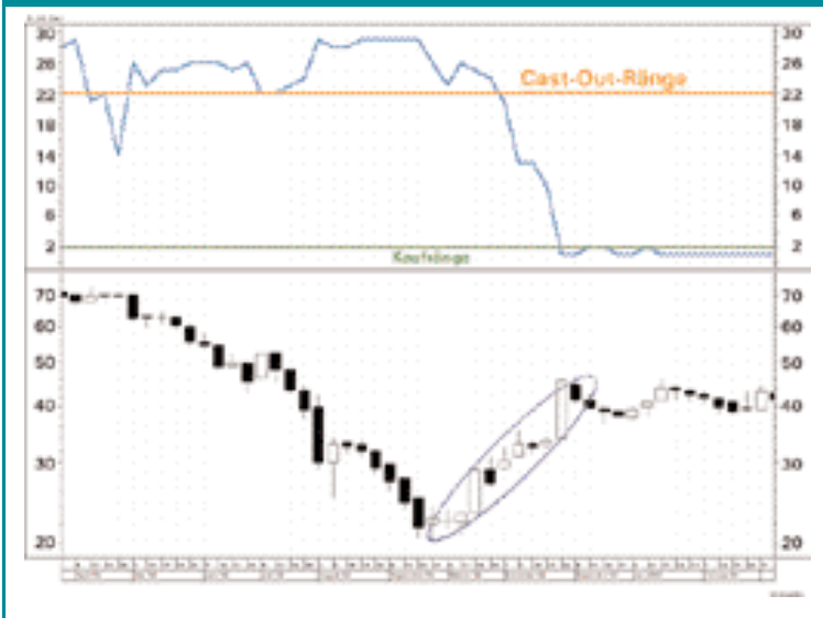
ABB. 1: VOM CAST-OUT-RANG IN DIE SPITZENGRUPPE – DER WEG IST DAS ZIEL

Trotz der dargestellten theoretischen Vorteile vergleichender Analysen ist für den Erfolg letztlich die praktische Umsetzung entscheidend. Kritisch ist in diesem Zusammenhang insbesondere die Verwendung absoluter Rangziffern als Signalgeber. Zum einen muß ein Wert bereits eine enorme Relative Stärke entwickelt haben, um in den Bereich der „happy few“ der oberen 5 % vorzustoßen, zum anderen kann der Weg bis zu den verkaufsauslösenden Cast-out-Rängen eine ausgesprochen kostspielige Angelegenheit werden. Im Ergebnis kommen sowohl die Kauf- als auch die Verkaufssignale relativ spät. In Abb. 1 ist dieser Effekt für Fresenius Medical Care für die letzten Monate demonstriert. Die blaue Linie über dem Kursverlauf zeigt jeweils die wöchentliche Relative-Stärke-Rangziffer der Aktie innerhalb des Dax 30 an. Die waagrechte grüne Linie markiert die Kaufränge (1 und 2); die waagrechte orange Linie zeigt die Verkaufsränge 22 bis 30. Das Kaufsignal in der letzten Novemberwoche 2002 wurde erst ausgelöst, nachdem (!) der Kurs bereits um mehr als 100 % gestiegen war. In der Folge kam der Titel dann nicht mehr von der Stel-