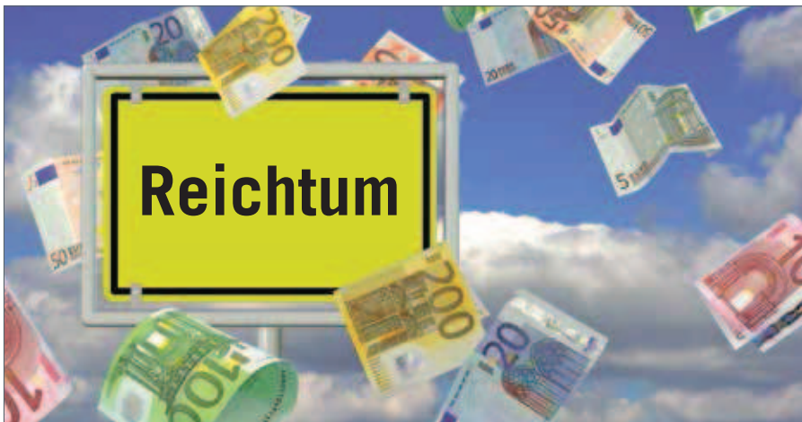
Illustration: © M. Schuppich – stock.adobe.com